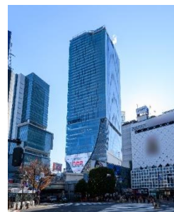
▲渋谷スクランブルスクエア外観

<本件に関する報道関係者さまからのお問合せ先> 渋谷スクランブルスクエア PR 事務局（株式会社サニーサイドアップ内） 担当：小池(080-7024-5953)、福井、正山、岩崎 TEL：03-6894-3200 FAX：03-5413-3050 E-mail： scramble_square_pr@ssu.co.jp