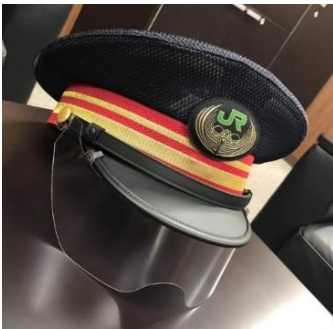
▲制帽装着型アイシールド

「渋谷スクランブルスクエア」15階の共創施設「SHIBUYA QWS（渋谷キューズ）」（以下、QWS）は、QWS内で活動するプロジェクトチーム Creators' Hub とともに、3Dプリンターやレーザーカッターなど、QWS内の設備を活用して開発した新しい形状の「制帽装着型アイシールド」を、東急渋谷駅、JR渋谷駅、東京メトロ渋谷駅に配備します。