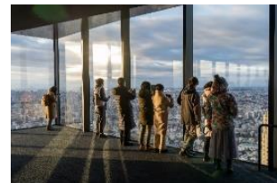
▲46階から見る日の出イメージ