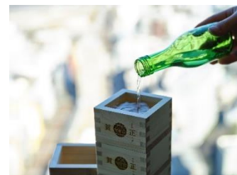
▲オリジナル合杓とお神酒（イメージ）

※賀正クーポンはイベント当日、SHIBUYA SKY SOUVENIR SHOP、Paradise Lounge でご利用いただけます