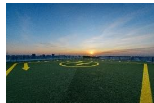
▲屋上から見る日の出イメージ

※荒天候時は、屋上「SKY STAGE」が閉鎖となるため、神事のみ中止となります