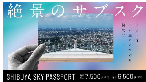
▲SHIBUYA SKY PASSPORT 告知ビジュアル