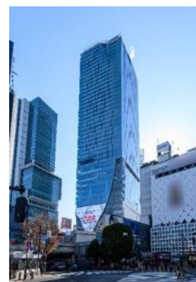
▲渋谷スクランブルスクエア外観

U R L : https://www.shibuya-scramble-square.com