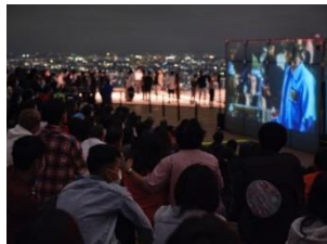
ROOFTOP "LIVE" THEATER