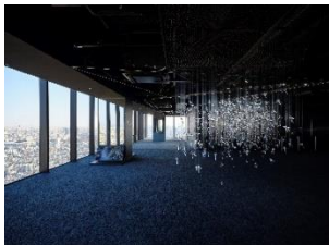
SKY GALLERY EXHIBITION SERIES

多くのカルチャーコンテンツは、イベント当日のSHIBUYA SKY 入場チケット、もしくは年間パスポートでご参加いただけます。本年も企画展「SKY GALLERY EXHIBITION SERIES」や「ROOFTOP 天体観測」などをはじめとする数々のイベントを予定しております。各イベント情報は随時公式サイトにて公開します。