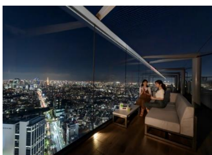
▲「THE ROOF SHIBUYA SKY」 ソファ席