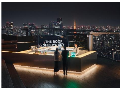
▲「THE ROOF SHIBUYA SKY」 バーカウンター