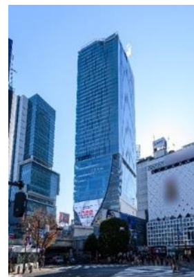
▲渋谷スクランブルスクエア外観

U R L : https://www.shibuya-scramble-square.com