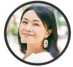
【インタビュアー】 芳麗/文筆家