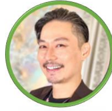
坂東工/俳優・アーティスト