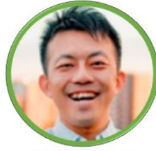
木下斉/まちづくり専門家