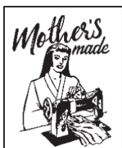
古着リメイク Mother's made