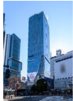
▲渋谷スクランブルスクエア外観

名称： 渋谷スクランブルスクエア／SHIBUYA SCRAMBLE SQUARE 事業主体： 東急(株)、東日本旅客鉄道(株)、東京地下鉄(株) 所在： 東京都渋谷区渋谷2丁目24番12号 用途： 事務所、店舗、展望施設、駐車場など 延床面積： 第Ⅰ期(東棟)約181,000㎡、第Ⅱ期(中央棟・西棟)約96,000㎡ 階数： 第Ⅰ期(東棟)地上47階地下7階、 第Ⅱ期(中央棟)地上10階地下2階、(西棟)地上13階地下5階 高さ： 第Ⅰ期(東棟)229m、第Ⅱ期(中央棟)約61m、(西棟)約76m 設計者： 渋谷駅周辺整備計画共同企業体 ※(株)日建設計、(株)東急設計コンサルタント、(株)JR東日本建築設計、 メトロ開発(株) デザイナー/アキオ： (株)日建設計、(株)隈研吾建築都市設計事務所、(有)SANAA事務所 運営会社： 渋谷スクランブルスクエア(株) ※東急(株)、東日本旅客鉄道(株)、東京地下鉄(株)の3社共同出資 開業： 第Ⅰ期(東棟)2019年11月1日 第Ⅱ期(中央棟・西棟)2027年度 URL： https://www.shibuya-scramble-square.com