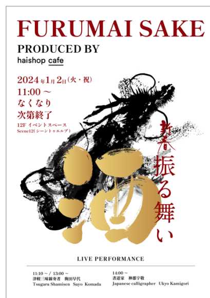
▲イベントポスター