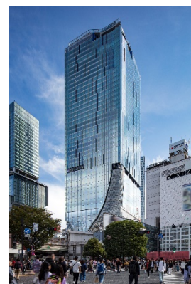
▲渋谷スクランブルスクエア外観

名称： 渋谷スクランブルスクエア／SHIBUYA SCRAMBLE SQUARE 事業主体： 東急(株)、東日本旅客鉄道(株)、東京地下鉄(株) 所在： 東京都渋谷区渋谷2丁目24番12号 用途： 事務所、店舗、展望施設、駐車場など 延床面積： 第Ⅰ期(東棟)約181,000㎡、第Ⅱ期(中央棟・西棟)約96,000㎡ 階数： 第Ⅰ期(東棟)地上47階地下7階、 第Ⅱ期(中央棟)地上10階地下2階、(西棟)地上13階地下5階 高さ： 第Ⅰ期(東棟)229m、第Ⅱ期(中央棟)約61m、(西棟)約76m 設計者： 渋谷駅周辺整備計画共同企業体 ※(株)日建設計、(株)東急設計コンサルタント、(株)JR東日本建築設計、 メトロ開発(株) デザイン・行先： (株)日建設計、(株)隈研吾建築都市設計事務所、(有)SANAA 事務所 運営会社： 渋谷スクランブルスクエア(株) ※東急(株)、東日本旅客鉄道(株)、東京地下鉄(株)の3社共同出資 開業： 第Ⅰ期(東棟)2019年11月1日 第Ⅱ期(中央棟・西棟)2027年度 URL： https://www.shibuya-scramble-square.com