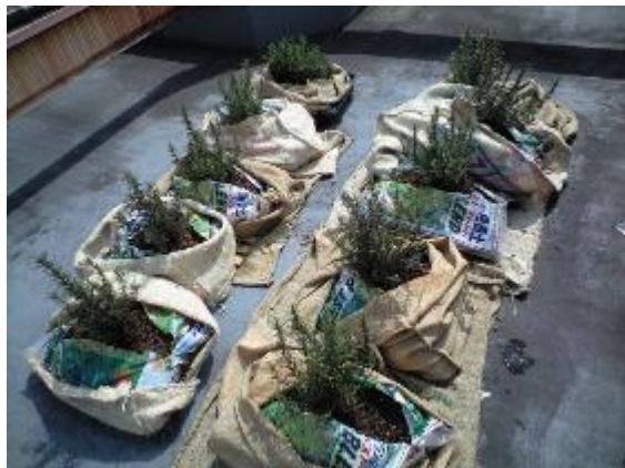
【渋谷区の複合施設の屋上でハーブを栽培】