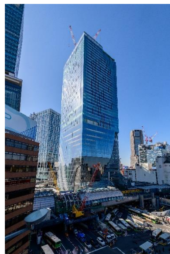
▲渋谷スクランブルスクエア外観

名称： 渋谷スクランブルスクエア／SHIBUYA SCRAMBLE SQUARE 事業主体： 東急(株)、東日本旅客鉄道(株)、東京地下鉄(株) 所在地： 東京都渋谷区渋谷2丁目24番12号 用途： 事務所、店舗、展望施設、駐車場など 延床面積： 第Ⅰ期(東棟)約181,000㎡、第Ⅱ期(中央棟・西棟)約96,000㎡ 階数： 第Ⅰ期(東棟)地上47階 地下7階、 第Ⅱ期(中央棟)地上10階 地下2階、(西棟)地上13階 地下5階 高さ： 第Ⅰ期(東棟)約230m、第Ⅱ期(中央棟)約61m、(西棟)約76m 設計者： 渋谷駅周辺整備計画共同企業体 ※(株)日建設計、(株)東急設計コンサルタント、(株)JR東日本建築設計、 メトロ開発(株) デザイナー： (株)日建設計、(株)隈研吾建築都市設計事務所、(有)SANAA事務所 運営会社： 渋谷スクランブルスクエア(株) ※東急(株)、東日本旅客鉄道(株)、東京地下鉄(株)の3社共同出資 開業： 第Ⅰ期(東棟)2019年11月1日 第Ⅱ期(中央棟・西棟)2027年度 URL： https://www.shibuya-scramble-square.com