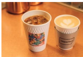
▲imperfect (インパーフェクト) 「ジンジャー香るメープルシロップオーツミルクラテ」