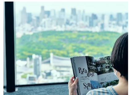
▲開催当時の展示風景