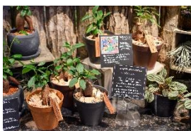
▲青山フラワーマーケット 「アースフレンドリーなガジュマル」