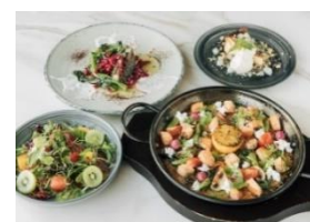
▲La Coquina cervceria (ラ コキーナ セルベセリア) 「ブルーサークルサーモンと有機野菜のパエージャ /アイスランド産タイセイヨウサバのブランチャ /シャインマスカットを使った有機野菜サラダ /自家製バスクチーズ にっくり梨のソース」