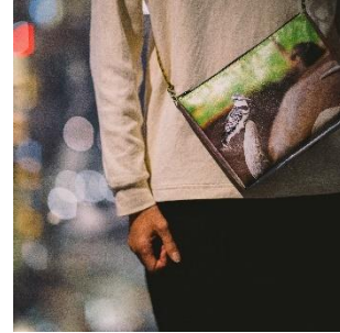
▲過去の展示作品をアップサイクルして制作したトラベルポーチ