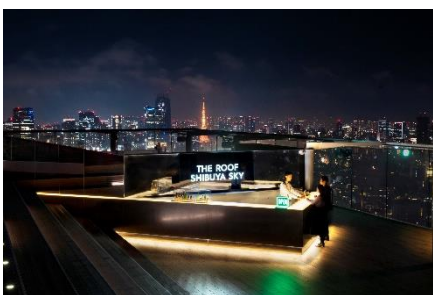
▲「THE ROOF SHIBUYA」 バーカウンター

「THE ROOF SHIBUYA SKY」は、オープンエアのエクスクルーシブな空間の中でカップルやご友人、来街されるお客さまと共に、渋谷の「カルチャー」・「新しい時間の楽しみ方」を育てていくことを目指します。入場はソファ席のみ日付・時間指定のチケット制となり、席数限定での販売です。