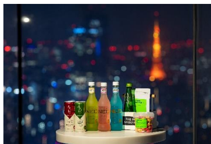
▲夜景に映える ドリンク&スナック