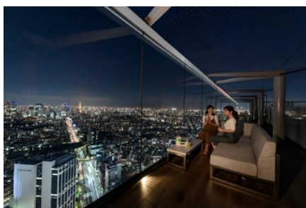
▲「THE ROOF SHIBUYA」 ソファ席