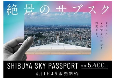
▲SHIBUYA SKY PASSPORT 告知ビジュアル

名称：渋谷スクランブルスクエア／SHIBUYA SCRAMBLE SQUARE 事業主体：東急(株)、東日本旅客鉄道(株)、東京地下鉄(株) 所在：東京都渋谷区渋谷2丁目24番12号 用途：事務所、店舗、展望施設、駐車場など 延床面積：第Ⅰ期（東棟）約181,000㎡、第Ⅱ期（中央棟・西棟）約96,000㎡ 階数：第Ⅰ期（東棟）地上47階 地下7階、 第Ⅱ期（中央棟）地上10階 地下2階、（西棟）地上13階 地下5階 高さ：第Ⅰ期（東棟）約230m、第Ⅱ期（中央棟）約61m、（西棟）約76m 設計者：渋谷駅周辺整備計画共同企業体 ※(株)日建設計、(株)東急設計コンサルタント、(株)JR東日本建築設計、 メトロ開発(株) デザイナー・アークト：(株)日建設計、(株)隈研吾建築都市設計事務所、(有)SANAA 事務所 運営会社：渋谷スクランブルスクエア(株) ※東急(株)、東日本旅客鉄道(株)、東京地下鉄(株)の3社共同出資 開業：第Ⅰ期（東棟）2019年11月1日 第Ⅱ期（中央棟・西棟）2027年度 URL： https://www.shibuya-scramble-square.com