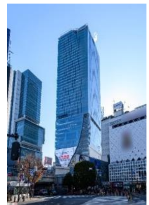
▲渋谷スクランブルスクエア外観