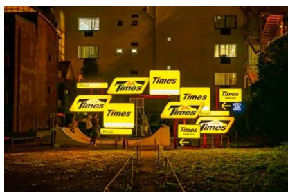
Installation view "地球 神宮前 空き地" 水の波紋 (東京)