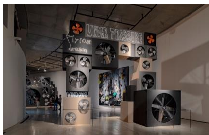
Installation view "under pressure" (ACAC,青森)