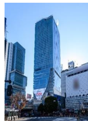
▲渋谷スクランブルスクエア外観

名称：渋谷スクランブルスクエア／SHIBUYA SCRAMBLE SQUARE 事業主体：東急(株)、東日本旅客鉄道(株)、東京地下鉄(株) 所在：東京都渋谷区渋谷2丁目24番12号 用途：事務所、店舗、展望施設、駐車場など 延床面積：第Ⅰ期（東棟）約181,000㎡、第Ⅱ期（中央棟・西棟）約96,000㎡ 階数：第Ⅰ期（東棟）地上47階 地下7階、 第Ⅱ期（中央棟）地上10階 地下2階、（西棟）地上13階 地下5階 高さ：第Ⅰ期（東棟）約230m、第Ⅱ期（中央棟）約61m、（西棟）約76m 設計者：渋谷駅周辺整備計画共同企業体 ※(株)日建設計、(株)東急設計コンサルタント、(株)JR 東日本建築設計、 メトロ開発(株) デザイナー/行外：(株)日建設計、(株)隈研吾建築都市設計事務所、(有)SANAA 事務所 運営会社：渋谷スクランブルスクエア(株) ※東急(株)、東日本旅客鉄道(株)、東京地下鉄(株)の3社共同出資 開業：第Ⅰ期（東棟）2019年11月1日 第Ⅱ期（中央棟・西棟）2027年度 URL： https://www.shibuya-scramble-square.com