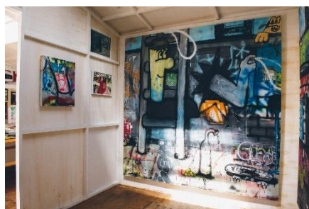
▲展示作品のイメージ