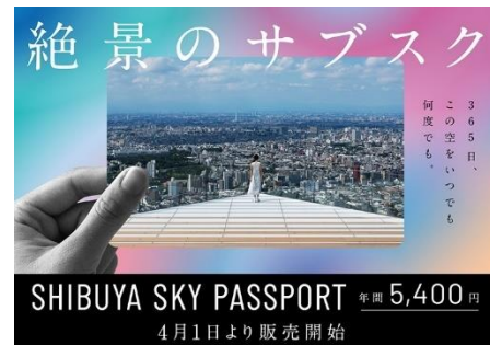
▲SHIBUYA SKY PASSPORT 告知ビジュアル

特設サイト： https://www.shibuya-scramble-square.com/sky/passport