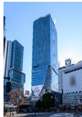
▲渋谷スクランブルスクエア外観

名称：渋谷スクランブルスクエア／SHIBUYA SCRAMBLE SQUARE 事業主体：東急(株)、東日本旅客鉄道(株)、東京地下鉄(株) 所在：東京都渋谷区渋谷2丁目24番12号 用途：事務所、店舗、展望施設、駐車場など 延床面積：第Ⅰ期（東棟）約181,000㎡、第Ⅱ期（中央棟・西棟）約96,000㎡ 階数：第Ⅰ期（東棟）地上47階 地下7階、 第Ⅱ期（中央棟）地上10階 地下2階、（西棟）地上13階 地下5階 高さ：第Ⅰ期（東棟）約230m、第Ⅱ期（中央棟）約61m、（西棟）約76m 設計者：渋谷駅周辺整備計画共同企業体 ※(株)日建設計、(株)東急設計コンサルタント、(株)JR東日本建築設計、 メトロ開発(株) デザイナー・行外：(株)日建設計、(株)隈研吾建築都市設計事務所、(有)SANAA 事務所 運営会社：渋谷スクランブルスクエア(株) ※東急(株)、東日本旅客鉄道(株)、東京地下鉄(株)の3社共同出資 開業：第Ⅰ期（東棟）2019年11月1日 第Ⅱ期（中央棟・西棟）2027年度 URL： https://www.shibuya-scramble-square.com