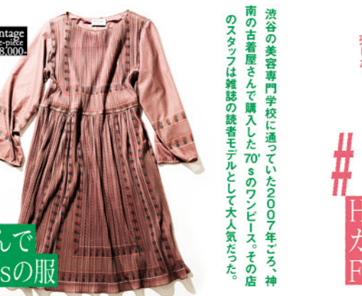
# 大人気の古着屋さんで買った70'sの服