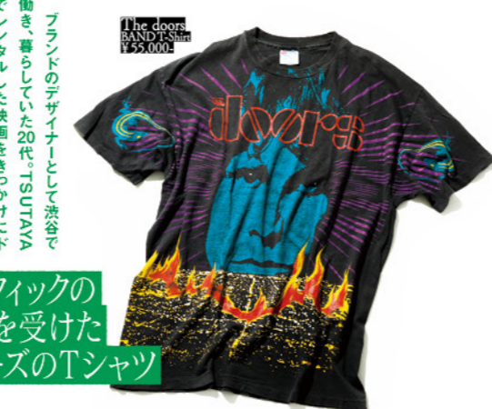
# グラフィックの影響を受けたドアーズのTシャツ