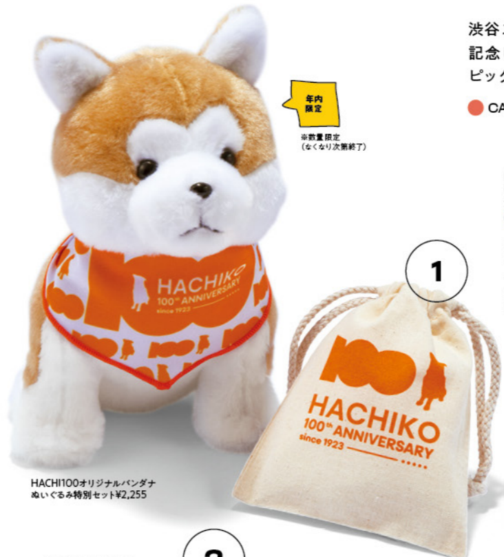
HACHI100 LIMITED STUFFED ANIMAL 14F ハチふる SHIBUYA meets AKITA GOODS

● CAFE & EAT-IN ● GOODS ● FASHION ○ FOOD