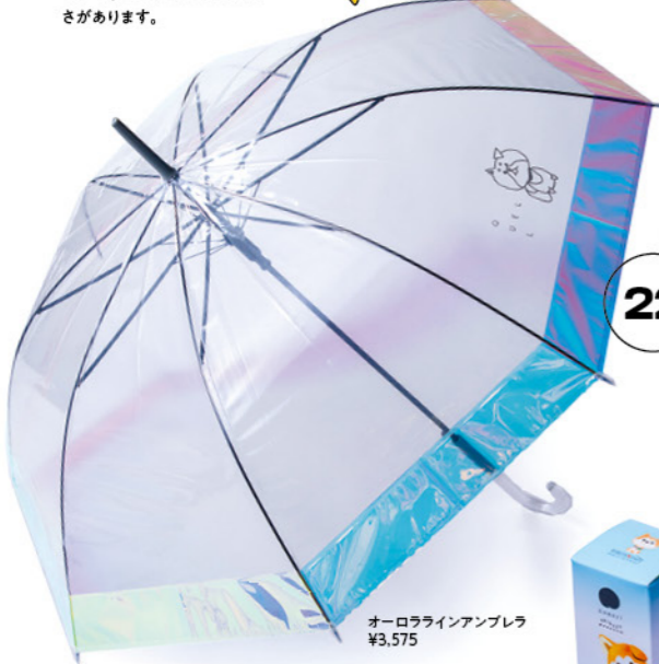
オーロラインアンブレラ ¥3,575