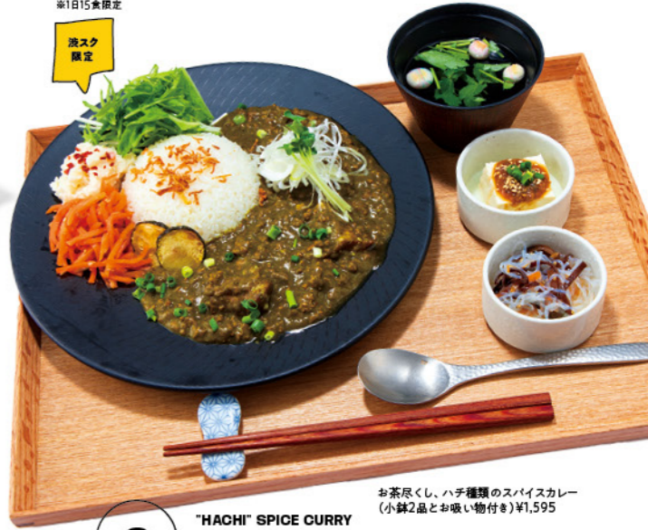
"HACHI" SPICE CURRY 14F 神楽坂 茶寮 CAFE & EAT-IN

カルダモン、クローブ、シナモンなど8種類のスパイスに宇治抹茶を加えた香り豊かなキーマカレー。そこに京都宇治の玉露で柔らかく煮込んだ玉露ポークをトッピング。多彩なスパイスと甘みのあるポークが織りなす一皿に、スプーンの上げ下げが止まらない!