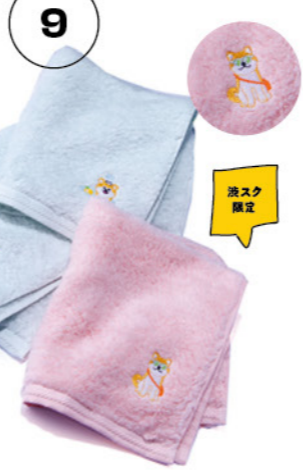
GUEST TOWEL 14F UCHINO relax GOODS

タオルにサングラスをかけたり、ゴロンと寝そべったり、ユニークで愛らしい秋田犬の刺しゅうが施されたタオルは、日々の暮らしに癒しをもたらしてくれる。自分のお気に入りのモチーフを手取るもよし、気心の知れたあの人を思い浮かべながら蒸ぶもよし。