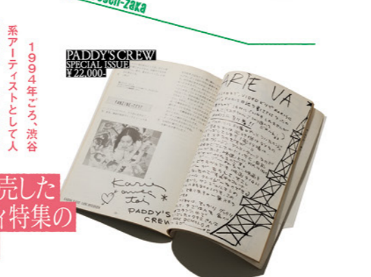
# HMVで完売したカヒミ・カリイ特集のFanZINE