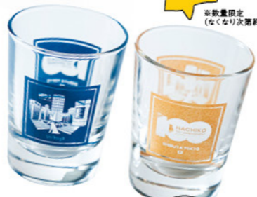
ハチ100ショットグラス ¥770 ハチカチューシャ ¥1,320