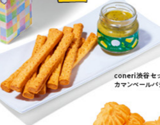
coneri渋谷セット (ハチ公デザイン) カマンベールバジル ¥1,782