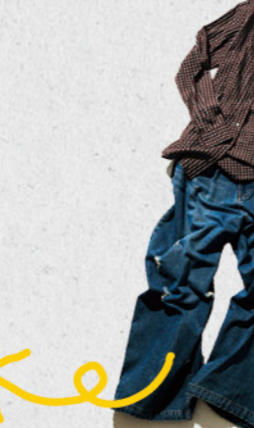
# 11月3日(金・祝)から開催される「FLEA MARKET」に出品決定!ぜひ次ページをチェックしてみてください!

ギャルファッションのムーブメントを巻き起こした「マルキュー」スクランブル交差点の先にそびえる「SHIBUYA109」。黒肌に厚底ブーツにミニスカートなどのファッションに身を包んだ「コギャル」の聖地として、世界的な知名度を誇る。