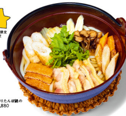
比内地鶏きりたんぽ鍋のおうどん ¥1,880