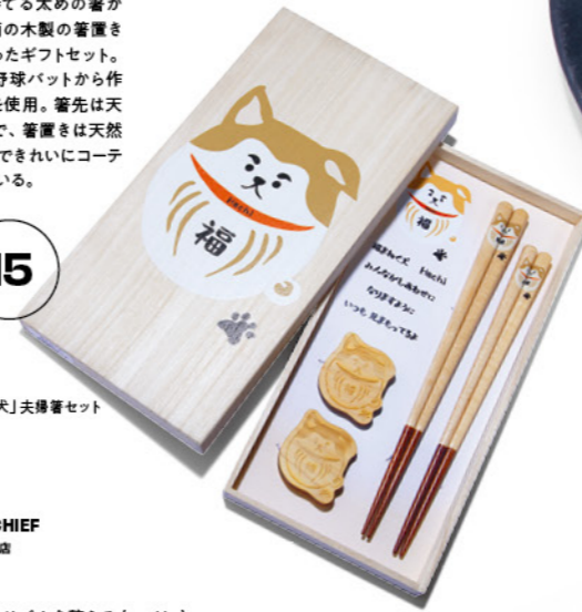
「福まねく犬」夫婦箸セット ¥5,500