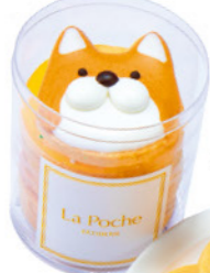
メッセージワンコ ¥994

※先行販売 ※期間中、¥22,000(税込)以上ご購入 いただいた方にオリジナルタグをプレゼント。