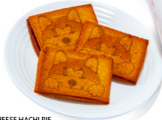
HACHEESE HACHI PIE ハチのふるさと・秋田産りんごのパイ ¥1,782

ハチの一生を描いた絵本作品「HACHI-ハチ-」をモチーフとしたスイーツ。ハチと博士が絆を深めた日々の積み重ねを、生地を重ねて丁寧に焼き上げたパイで表現。生地にはハチのふるさとである秋田の米粉と味噌を使い、甘酸っぱい秋田産りんごのジャムをサンド。