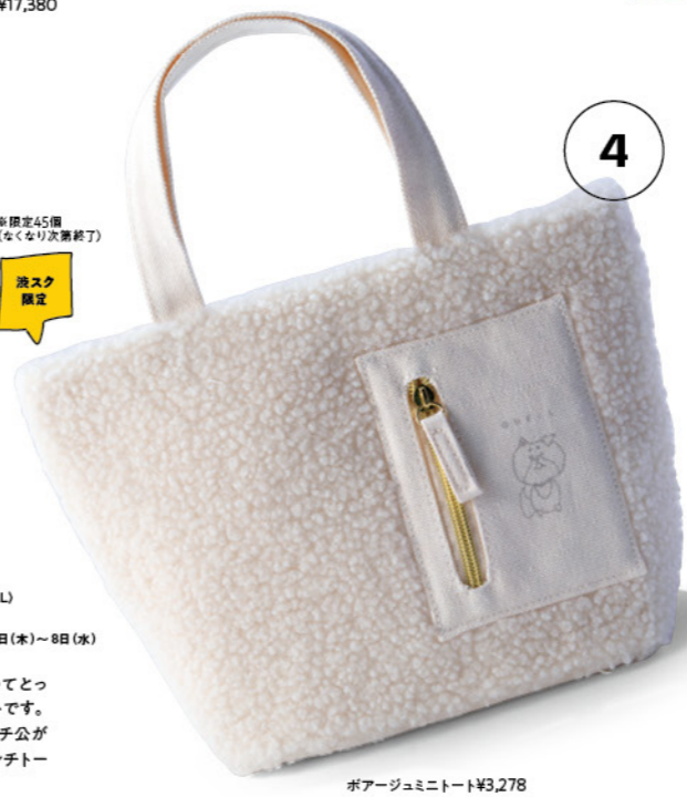
TOTE BAG 6F Event Stage6E (QUELL) POP-UP STORE GOODS 期間:11月2日(木)~8日(水)

ポアがもこもこしていてもかわいいミニトートです。さりげなくかわいいハチ公がいます! 使いやすいランチョートサイズです。