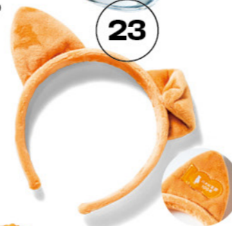
耳の裏には 生誕100年の刺繍も!