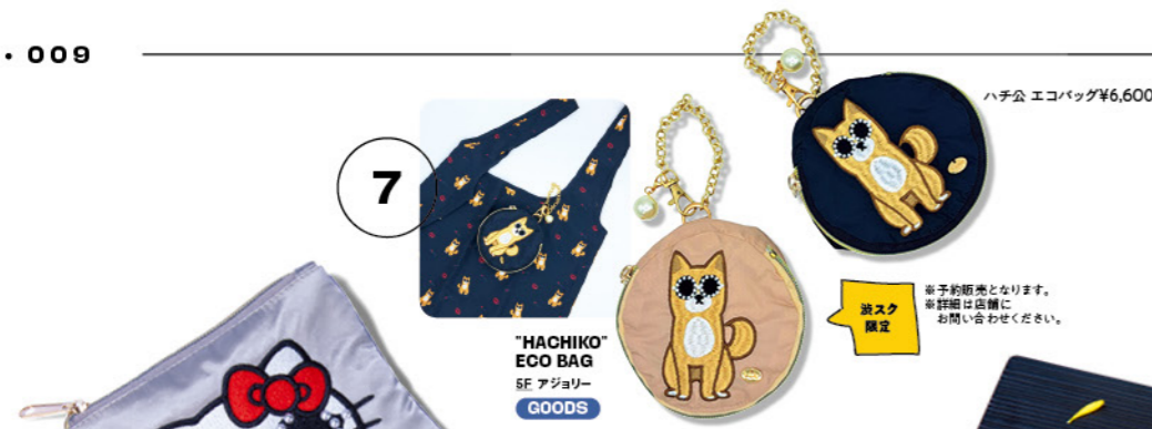
TISSUE POUCH & BAG CHARM 5F アジョリー GOODS

キティちゃんの誕生日である11月1日に先駆けて発売されるティッシュバッグチャーム。いつも愛用しているバッグなどに付けて街歩きを楽しもう。