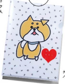
クリアファイル ノベルティ