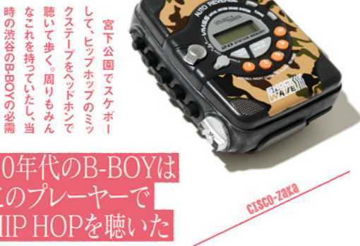
# 90年代のB-BOYはこのプレーヤーでHIP HOPを聴いた