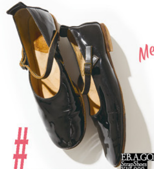
# エバゴスのストラップシューズで神南へ

10代で「オリーブ」に夢中になってファッション編集者を 目指し、なぜか宝島社で「キエティ」の編集者となって、 29歳でフリーに。復刊した「オリーブ」やリラックス フォーガールズで仕事をもらえた。エバゴスの ストラップシューズとキャサリンコートで歩く渋谷は、 ウキウキと痛快だった。