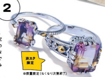
AMETRINE RING 5F Biju mam GOODS

(Biju mam)の姉妹ブランド、(Biju mam poco)の渋谷店限定リング。紫色のアメジストと黄色のシトリンが自然に結晶した希少な天然石、アメトリンを使用。関東では渋谷スクランブルスクエア店のみ取り扱い!! 2周年記念渋谷店限定「アメトリン」リング 左:¥14,080 右:¥17,380