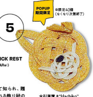
"HACHIKO" MIZUHIKI CHOPSTICK REST 5F Event Stage5A (HOMARe) POP-UP STORE GOODS

伝統的な手仕事として知られ、贈答品や封筒に付けられる飾り紐の「水引」によって渋谷のシンボル、ハチ公を表現した箸置き。古来より水引の結びには魂が宿り、邪気を払うと言い伝えられてきたそう。ちょっといいことがあった日や友人をおもてなしする際に。