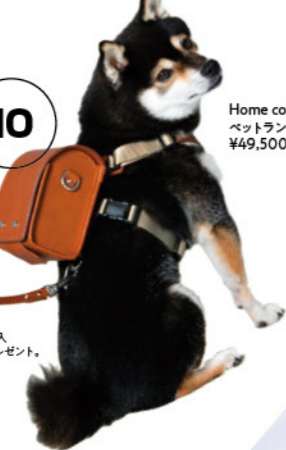
Home collection ペットランドセル ¥49,500

※先行販売 ※期間中、¥22,000(税込)以上ご購入 いただいた方にオリジナルタグをプレゼント。