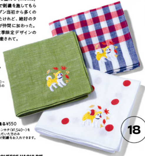
渋谷犬刺繍各 ¥550 ※mottaのハンカチ(¥1,540)をご購入いただいた方のみ オプションで刺繍をお入れできます。