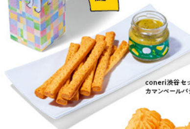
coneri渋谷セット(ハチ公デザイン) カマンベールバジル¥1,782