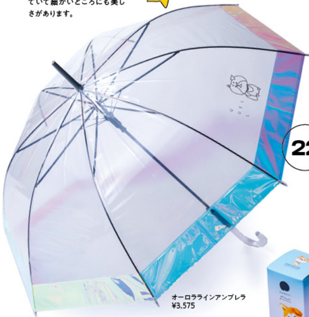
オーロラインアンブレラ ¥3,575