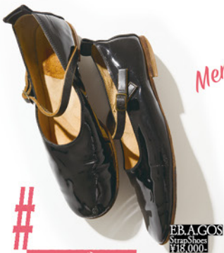
エバゴスのストラップシューズで神南へ

10代で「オリブ」に夢中になってファッション編集者を目指し、なぜか宝島社で「キューティ」の編集者となって、29歳でフリーに。復刊した「オリブ」や「リラックスフォーガールズ」で仕事をもらえたころ、エバゴスのストラップシューズとギャザースカートで歩く渋谷は、ウキウキと痛快だった。