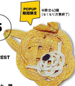
ポアージュミニトート ¥3,278

ポアがもこもこしていてもかわいいミニトートです。さりげなくかわいいハチ公がいます!使いやすいランチトートサイズです。