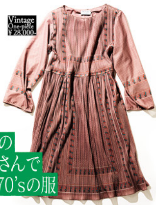
Vintage One-piece ¥28,000