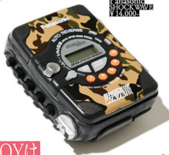
Panasonic SHOCK WAVE ¥14,000

宮下公園でスケボーして、ヒップホップのミックステープをヘッドホンで聴いて歩く。周りもみんなこれを持っていて、当時の渋谷のBOYの必需品だった。