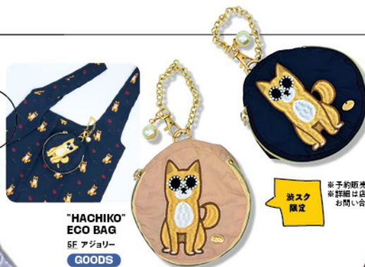
"HACHIKO" ECO BAG 5F アジョリー GOODS