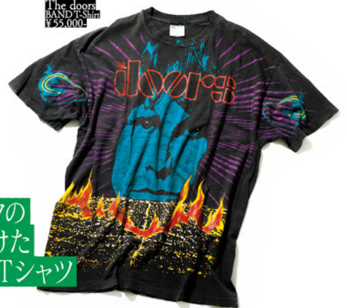
The doors BAND T-Shirt ¥55,000

ブランドのデザイナーとして渋谷で働き、暮らしていた20代。T.SUTAVAでレンタルした映画をきっかけにドアーズが好きになって、古着で手に入れたTシャツ。