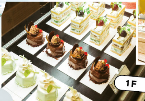
1F | FRUCTUS

家族や友達へのお祝い事の際にお世話になっています。見た目の可愛さはもちろんのこと、裏切らない美味しさのケーキに胃袋を掴まれています! ホールで買うと、丁寧に可愛くチョコペンでプレートしてくれるのも幸せです。