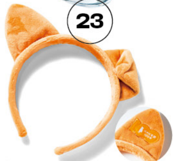
耳の裏には 生誕100年の刺繍も!