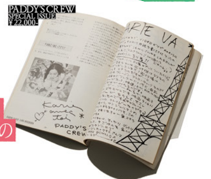
PADDY'S CREW SPECIAL ISSUE ¥22,000

1994年ごろ、渋谷系アーティストとして人気のカヒミ・カリイにロングインタビューを決定。販売した自主製作の音楽誌「ファンジン」はEMVで完売した。