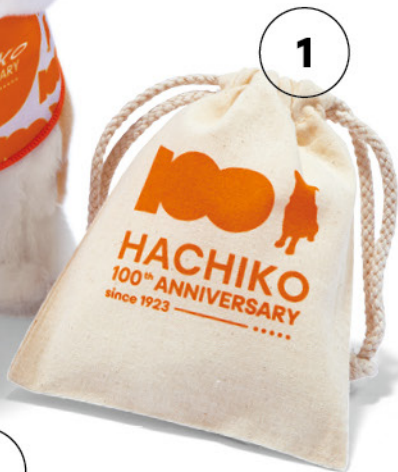
HACHI100オリジナルバンダナ ぬいぐるみ特別セット ¥2,255