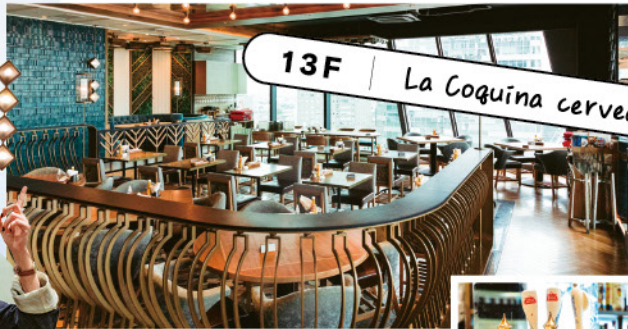
13F | La Coquina cervceria

とにかく見晴らしが良すぎるんですよ。13Fから渋谷を一望しながらスペイン料理…贅沢すぎませんか? オススメは魚介のパエリアとほうれん草のパエリア。写真映えるし、サイズ感もちょうど良くて最高です!