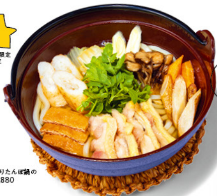
比内地鶏きりたんぽ鍋の おうどん¥1,880