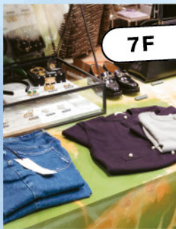
7F | Le Dome ÉDIFICE et IÉNA